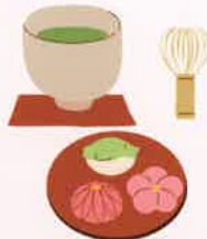
抹茶とお菓子のいただき方