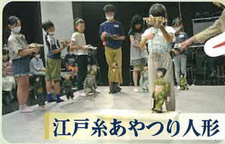
江戸系あやつり人形