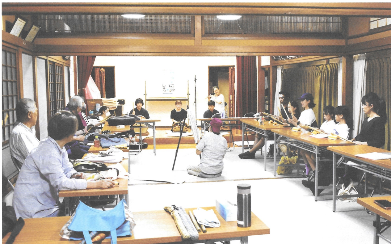
月曜午後7時から子どもたちも交えた練習が四丁目氷川神社の社務所2階で始まる。

「ソイヤ・ソイヤ」「エッサ・ホイサ」威勢のいい神輿の掛け声、「テンツクテンテン」「ピーヒャラララ」 かんだばやし 神田囃子の小気味よいリズム♪千住っ子が待ちに待った祭りが4年ぶりに帰ってきた。9月9日(土)に開催された千住本町連合会による五町会連合神輿渡御の様子は11月号に掲載予定。