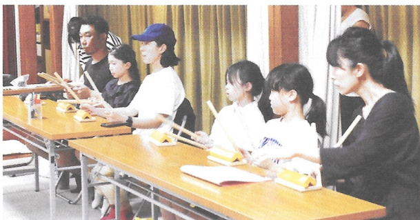
初参加の親子も練習台を叩く

午後7時から1時間は子どもの部。舞台の上の演奏に合わせて会員手作りの締太鼓練習台 しめだいて を撥 ばち で叩いていく。入会したてのお子さんたちも模造紙大の楽譜を目で追いながら一生懸命練習台を叩く。子どもはリズム感が良いので覚えるのも早そうだ。