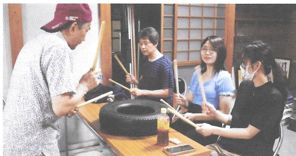
舞台の順番待ちまで練習用のタイヤを叩く

小学3年生から参加しているという20歳の女性に神田囃子の魅力を聞くと「祭りで演奏する気分は最高！今年の神田祭での演奏が動画サイトに載っていた」と嬉しそうに答えてくれた。