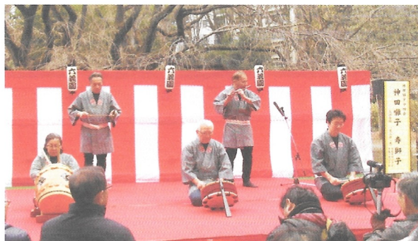
六義園での上演風景(2020年1月神田囃子 寿獅子)