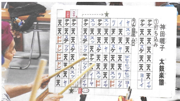
神田囃子 太鼓楽譜

神田囃子は太鼓 かね ・締太鼓 しのぶえ 2人・鉦 かね ・篠笛 しのぶえ の5人で編成されている。篠笛は「トンビ」ともいわれ、なだらかな美しい音色を出す。鉦はほかの4人を助ける役割を担っていることから「四助 よすけ 」とも呼ばれる。「テケ天天天天天」という締太鼓の打ち込みで始まり、屋台 やたい ・昇殿 しょうでん /聖天 しちようめ ・鎌倉 しちようめ ・仕丁目/四丁目という6曲が基本となり、順に演奏される。1回の演奏は約20分。