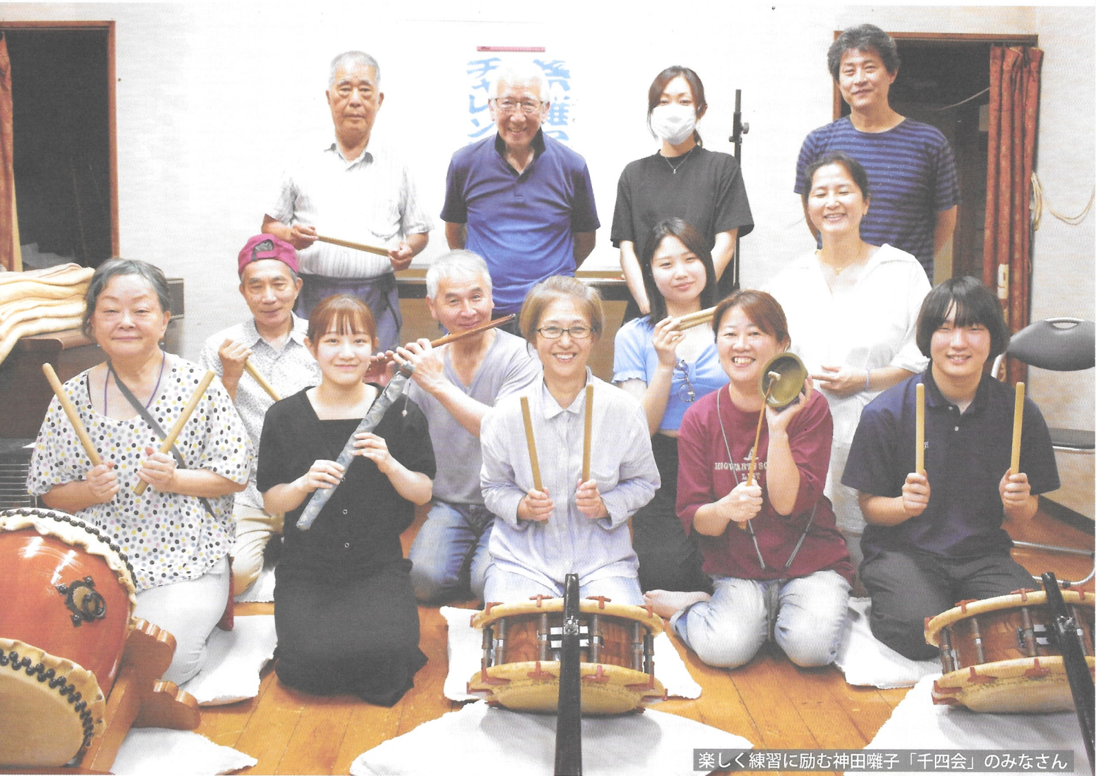
楽しく練習に励む神田囃子「千四会」のみなさん