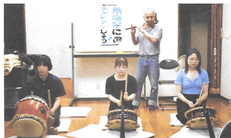
大人の舞台上の練習